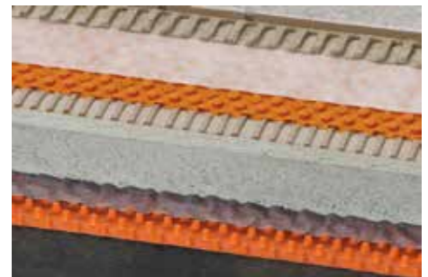
Schlüter®-TROBA-PLUS 8 (12)