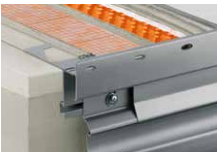
Aufbau mit Schlüter®-DITRA-DRAIN 8 und Schlüter®-BARA-RTKE 23