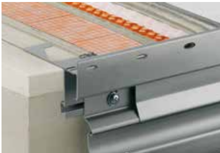
Aufbau mit Schlüter®-DITRA-DRAIN 4 und Schlüter®-BARA-RTKE