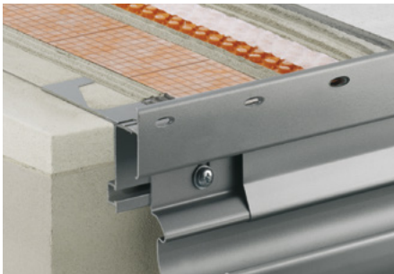
Aufbau mit Schlüter®-DITRA-DRAIN 4 und Schlüter®-BARA-RTKE