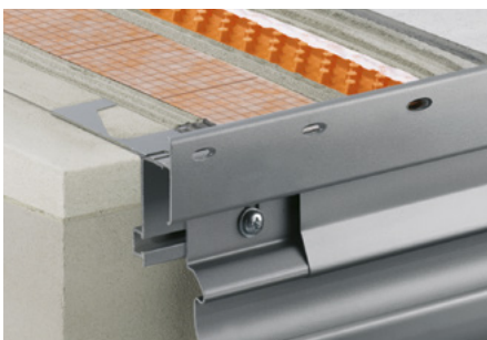
Aufbau mit Schlüter®-DITRA-DRAIN 8 und Schlüter®-BARA-RTKE 23