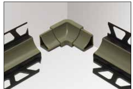
Innenecke I2 (2 Abgänge)