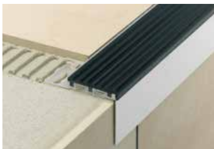
Schlüter®-TREP-B mit Schlüter®-TREP-TAP