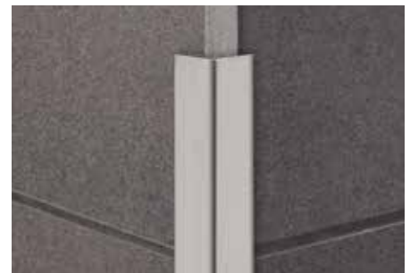
Schlüter-ECK-K 15 EB

Der Kontakt mit anderen Metallen wie z.B. normalem Stahl ist zu vermeiden, da dies zu Fremdrost führen kann. Dies gilt auch für Werkzeuge wie Spachtel oder Stahlwolle, um z.B. Mörtelrückstände zu entfernen. Im Bedarfsfall empfehlen wir die Verwendung der Edelstahl-Reinigungspolitur Schlüter-CLEAN-CP.