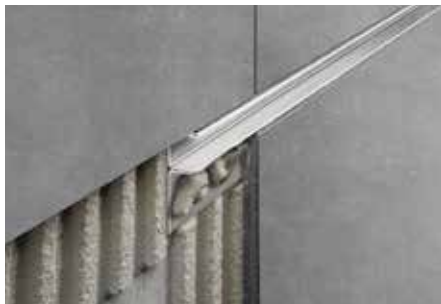
Einbau als Schattenfuge im Wandbereich