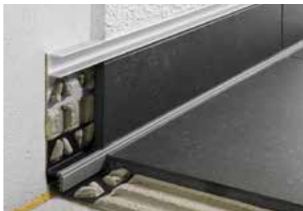
Einbau im Sockelbereich