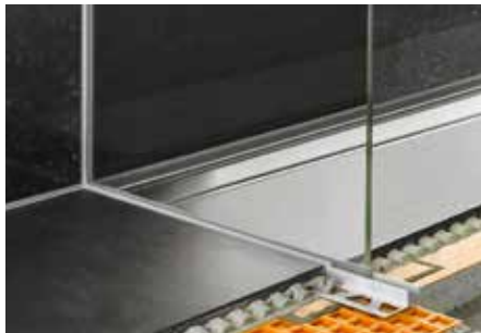
Einbau im Duschbereich mit einem Glaselement