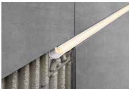
Einbau als Akzentbeleuchtung mit LED-Modul LIPROTEC-LLPM

Deshalb sind Mörtel oder Fugenmaterial an Sichtflächen sofort zu entfernen und frisch verlegte Beläge nicht mit Folie abzudecken. Das Profil ist vollflächig in die Kontaktschicht zur Fliese einzubetten, damit sich in den Hohlräumen kein Wasser ansammeln kann.