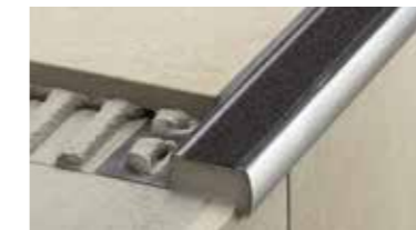
Schlüter®-TREP Rutschhemmende Treppenprofile