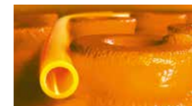
Schlüter®-BEKOTEC-THERM Der Keramik-Klimaboden