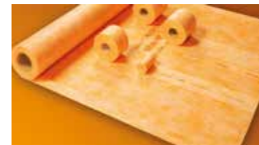
Schlüter®-KERDI Sichere Abdichtung in wenigen Schritten