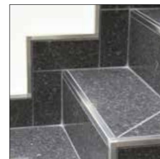
Treppenkante und Sockelabschluss

Die Edelstahl-Ausführung ist auch als Bodenabschluss oder Treppenkante einsetzbar. Ebenso lassen sich Abschlüsse, Ecken oder Sockelabdeckungen an anderen Materialien wie Teppich oder Parkett herstellen.