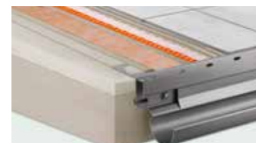
Schlüter®-Balkonsysteme Komplettlösung für Neubau und Sanierung von Balkonen und Terrassen