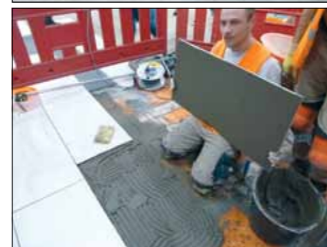
Um eine hohlraumfreie Verlegung zu gewährleisten, wurden die Fliesen im Buttering-Floating-Verfahren verlegt.