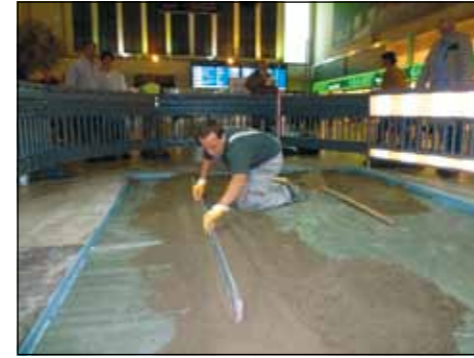
„Praxis-Vorführung“: Während Bahnreisende auf ihre verspäteten Züge warteten, konnten sie die Fliesenleger bei der Arbeit beobachten, hier bei der Vorbereitung des Untergrundes