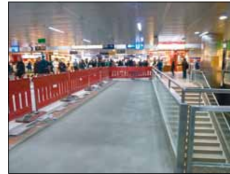
Da Feinsteinzeugplatten im Format 90x45 cm verlegt werden sollten, war ein planebener Untergrund eine wichtige Voraussetzung