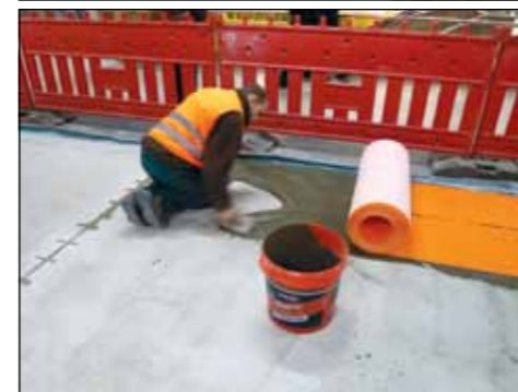
Die Entkoppelungs-Matte beschleunigte den Baufortschritt