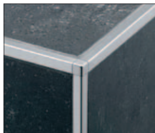
QUADEC als Kantenschutz