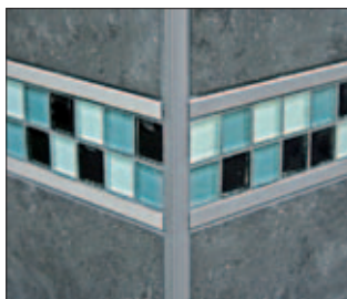
QUADEC als Design-Element

Um als Abschluss-Profil für Fliesenbeläge Karriere zu machen, muss das Produkt zwei wichtige Funktionen erfüllen: 1. einen guten Job als Kantenschutz machen und 2. dabei gut aussehen. Beides gelingt den Schlüter-QUADEC-Profilen ausgezeichnet, weshalb sie bei Handwerkern und Endkunden sehr beliebt sind. Sie sind leicht zu verarbeiten, von ausgezeichneter Qualität und überzeugen außerdem durch ihr elegantes Design. Da die Profile in verschiedenen Materialien (Edelstahl, Aluminium, Messing und PVC), Farben und Oberflächen erhältlich sind, können Sie die Außenkanten des Belags farblich gut auf die Fliesen und/oder Fugen abstimmen oder auch dekorative Kontraste schaffen. Die Varianten QUADEC-E und QUADEC-A aus Edelstahl bzw. Aluminium lassen sich gut mit den attraktiven Bordürenprofilen QUADEC-FS oder Schlüter-DESIGNLINE kombinieren. Profile aus Edelstahl, die es auch als polierte oder gebürstete Variante gibt, eignen sich aufgrund ihrer Strapazierfähigkeit auch als Bodenabschluss, als Dekoreinleger im Bodenbereich oder als Treppenkante. Obwohl die Profile in erster Linie für die Verarbeitung mit Fliesen oder Naturstein gedacht sind, können sie natürlich auch in Verbindung mit anderen Belagsarten wie Teppich oder Parkett verwendet werden.