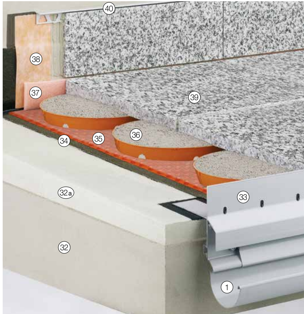
Weitere mögliche Anschlussprofile siehe „Konstruktionsaufbauten A: Frei auskragende Balkone“