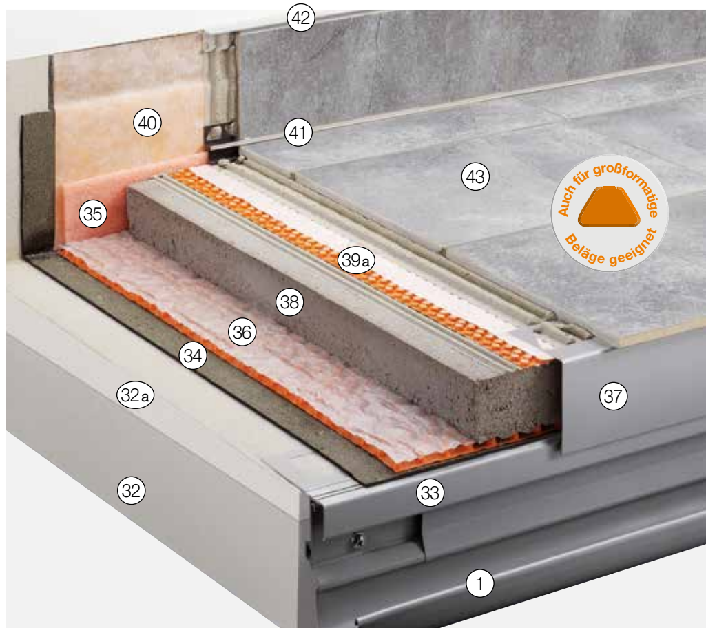
Weitere mögliche Anschlussprofile siehe „Konstruktionsaufbauten A: Frei auskragende Balkone“

Lieferbar in zahlreichen unterschiedlichen Farben und Oberflächen. Material: Edelstahl oder Aluminium farbig beschichtet