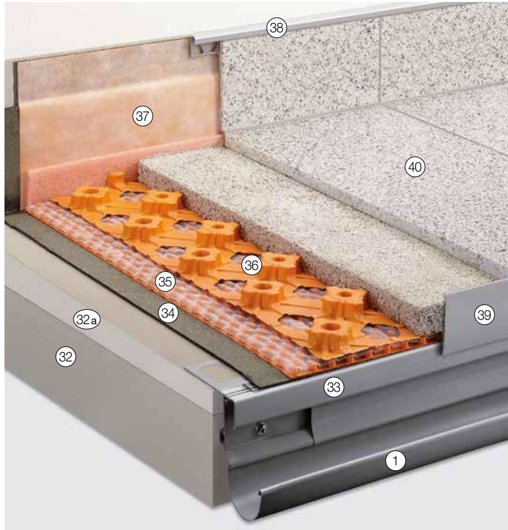
Weitere mögliche Anschlussprofile siehe „Konstruktionsaufbauten A: Frei auskragende Balkone“