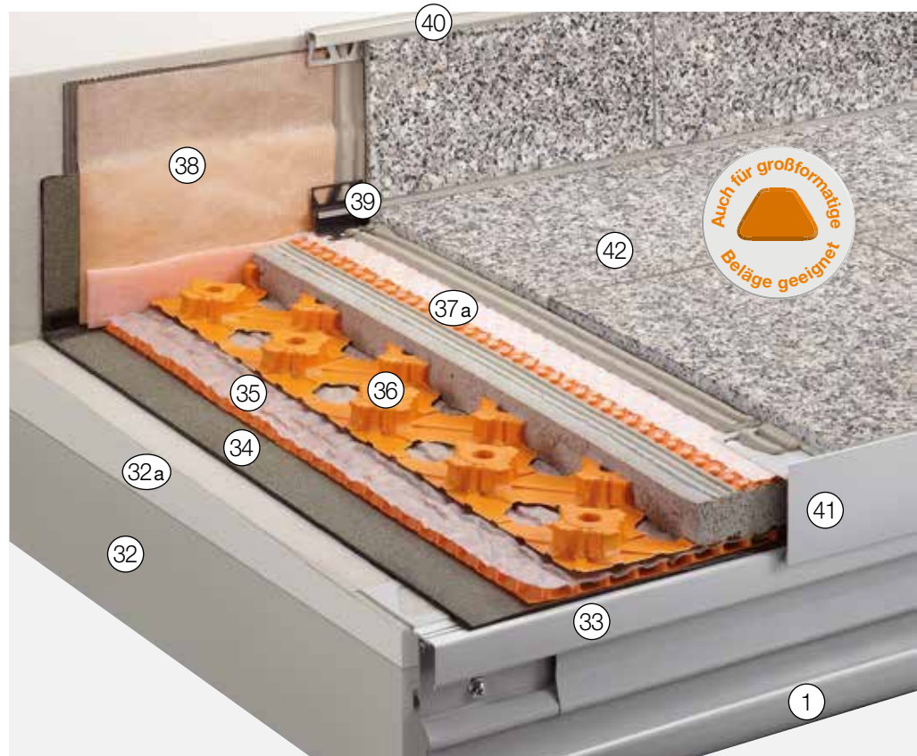
Weitere mögliche Anschlussprofile siehe „Konstruktionsaufbauten A: Frei auskragende Balkone“

Farben und Oberflächen. Material: Edelstahl oder Aluminium farbig beschichtet ④① Schlüter®-BARA-RT Randprofil mit Abschlusschenkel und Tropfkante. Entwässerungsmöglichkeit beachten!