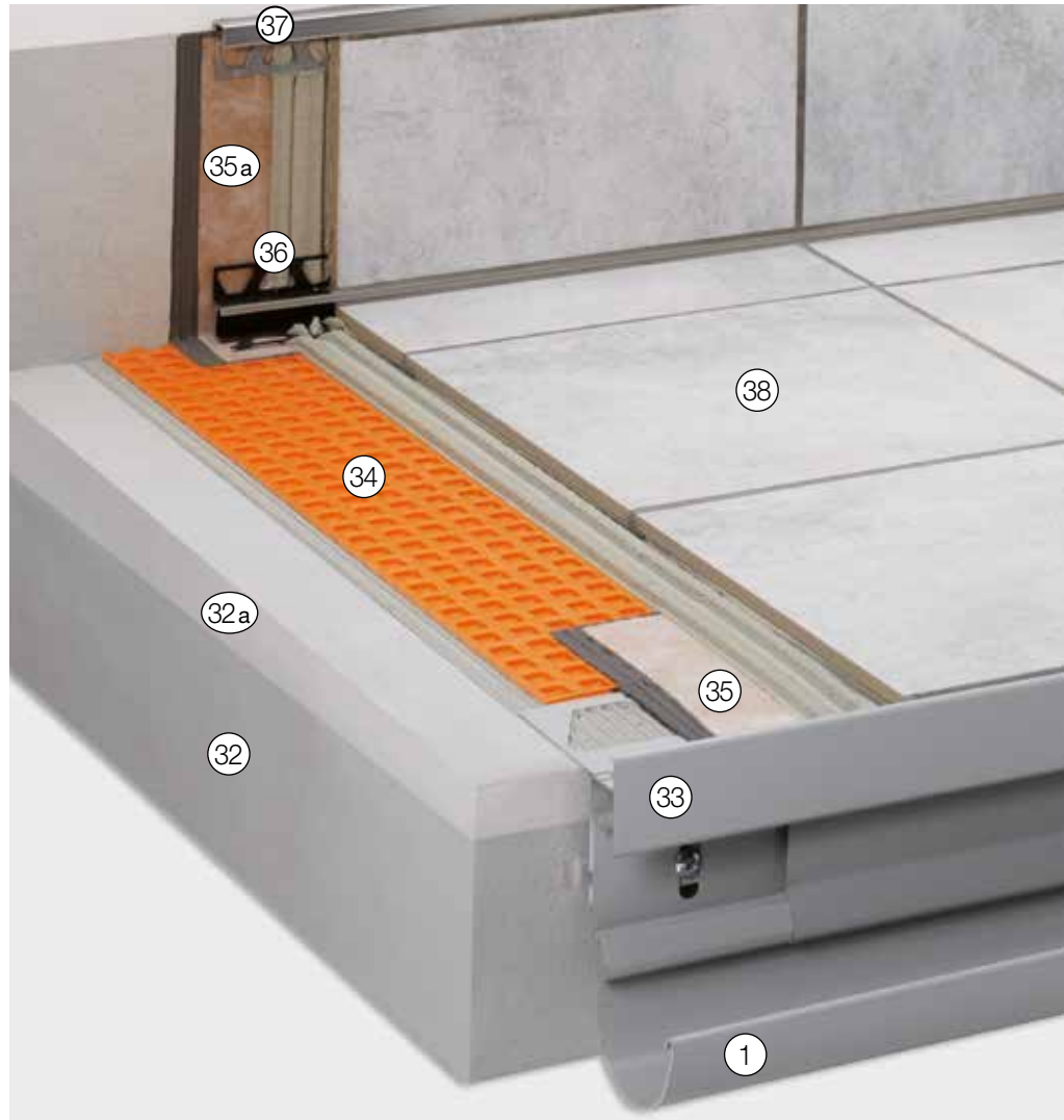
Weitere mögliche Anschlussprofile siehe „Konstruktionsaufbauten A: Frei ausragende Balkone“