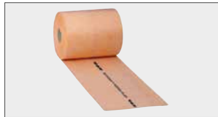
Schlüter®-KERDI-FLEX Flexibles Dichtband zum Abdichten über Bewegungsfugen