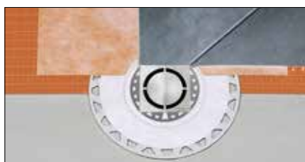
Schlüter®-KERDI-DRAIN Bodenablaufsystem für den sicheren Anschluss von Verbundabdichtungen mit Schlüter-KERDI oder sonstigen Verbundabdichtungssystemen an die Entwässerung