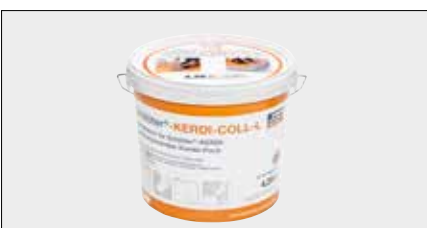
Schlüter®-KERDI-COLL-L ist ein zwei-komponentiger Dichtkleber auf Basis einer lösemittelfreien Acrylatdispersion und eines zementären Reaktivpulvers. Er eignet sich zum Verkleben und Abdichten der Überlappungen und Stoßverbindungen von Schlüter-KERDI Bahnen