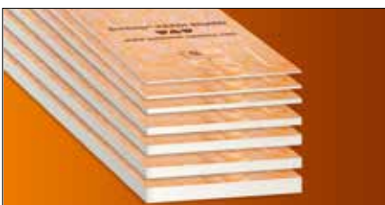
Schlüter®-KERDI-BOARD ist ein universell einsetzbarer Fliesen-Verlegeuntergrund für Wandbereiche aller Art, auch direkt als Verbundabdichtung. Schlüter-KERDI-BOARD ist auch als Untergrund für Spachtel- und Putzmörtel geeignet