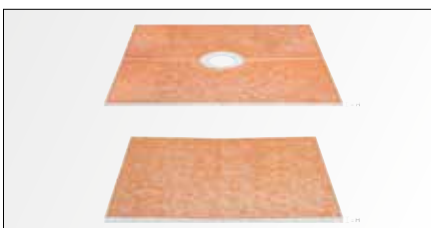
Schlüter®-KERDI-SHOWER / -SHOWER-L sind modulare Systeme zum Bau von bodenebenen Duschen mit keramischen Fliesen. In mehreren Abmessungen stehen Gefälleboards systemkonform für die zentrierte Entwässerung Schlüter-KERDI-DRAIN bzw. für die Linienentwässerung Schlüter-KERDI-LINE zur Verfügung