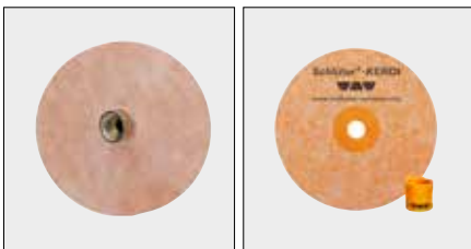
Schlüter®-KERDI-KM / -MV Manschetten für Rohrdurchführungen