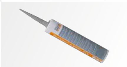
Schlüter®-KERDI-FIX eignet sich zum Verkleben und Abdichten von Abschlüssen von Schlüter-KERDI Abdichtungsbahnen