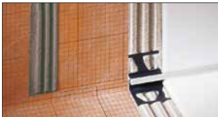
Schlüter®-KERDI-200 / -KERDI-DS für Abdichtungen im Verbund mit Fliesenbelägen an Wand und Boden