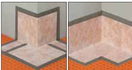
Schlüter®-KERDI-KERECK Vorgefertigte Außen- und Innenecken