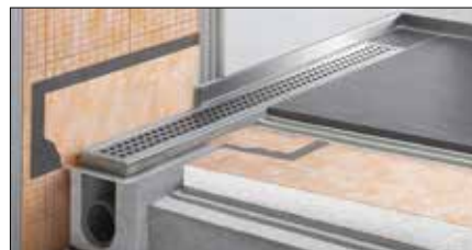
Schlüter®-KERDI-LINE Komplettsset für lineare bodenebene Duschen