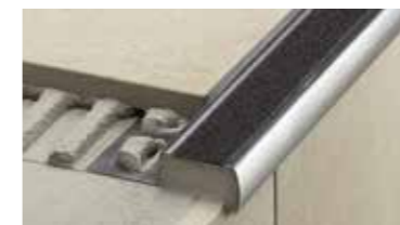
Schlüter®-TREP Rutschhemmende Treppenprofile