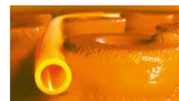
Schlüter®-BEKOTEC-THERM Der Keramik-Klimaboden