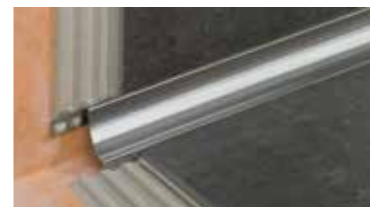
Schlüter®-DILEX Profilsystem für dauerhaft wartungsfreie Bewegungs- und Randfugen

Wollen Sie mehr über weitere Schlüter-Produkte und -Systemlösungen für die Fliesenverlegung erfahren? Folgende Broschüren sind bei unseren Vertriebspartnern erhältlich. Weitere Informationen bietet unsere Internet-Seite www.schlueter.de .