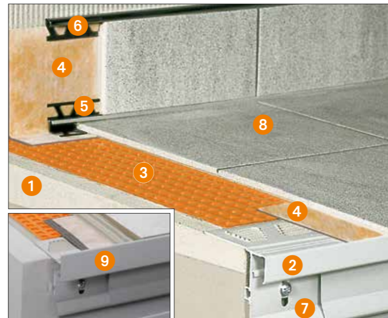
Aufbauvariante mit Balkonrandprofil 9 Schlüter-BARA-RTKEG