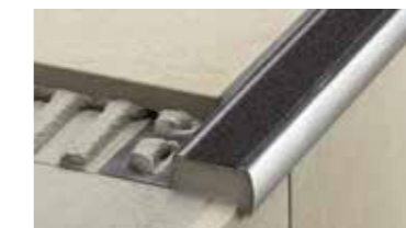
Schlüter®-TREP Rutschhemmende Treppenprofile