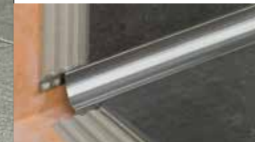
Schlüter®-DILEX Profilsystem für dauerhaft wartungsfreie Bewegungs- und Randfugen

Wollen Sie mehr über weitere Schlüter-Produkte und -Systemlösungen für die Fliesenverlegung erfahren? Folgende Broschüren sind bei unseren Vertriebspartnern erhältlich. Weitere Informationen bietet unsere Internet-Seite www.schlueter.de .