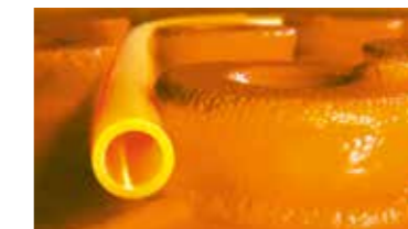
Schlüter®-BEKOTEC-THERM Der Keramik-Klimaboden