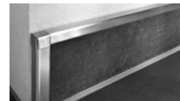
Schlüter®-RONDEC und -QUADEC Profilsysteme zur Gestaltung und zum Kantenschutz von Wandecken