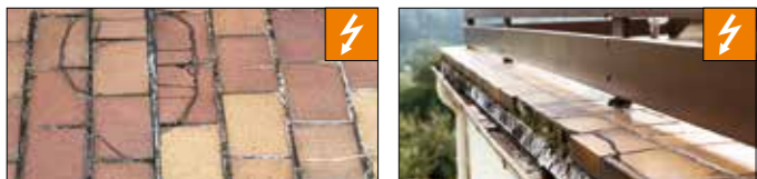
Solche Schäden verhindern Sie mit dem Schlüter-Balkonsystem

Im Randbereich wird das Schlüter-BARA-Profil eingebaut, an welchem später die Entwässerungsrinne Schlüter-BARIN angeschraubt werden kann. Mit Hilfe von Fliesenkleber wird dann die Schlüter-DITRA 25-Matte verlegt und direkt darauf die Fliesen. DITRA 25 bildet eine Abdichtung und schützt so vor Eindringen der Feuchtigkeit in die Unterkonstruktion. Sie ist in der Lage, aufgrund ihrer speziellen Struktur unterschiedliche Spannungen, die durch Temperaturwechselbeanspruchung zwischen Untergrund und Fliesenbelag auftreten, auszugleichen. Natürlich müssen der verwendete Fliesenkleber und die Fliesen frost- und witterungsbeständig sein.