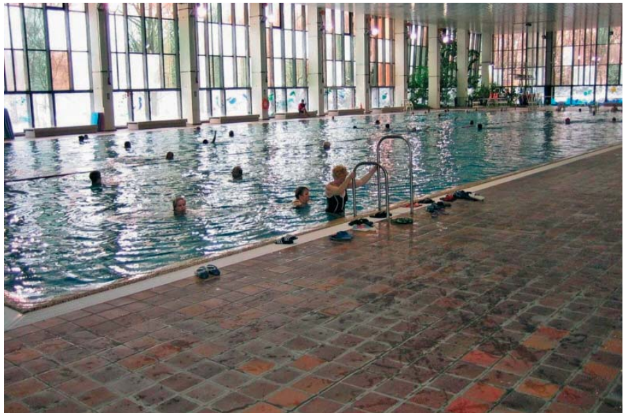
Nachdem der alte Fliesenbelag nach 27 Jahren unansehnlich und undicht geworden war, wurde er in nur sieben Wochen saniert und das 50 Meter-Becken wieder in Betrieb genommen.

In der Schwimmhalle des gemeinnützigen Familienzentrums in Berlin-Köpenick wurde der Beckenumgang des 50-Meter-Beckens saniert. Die Firmen Schlüter-Systems, Ardex und Cinca boten hierfür eine Systemlösung an, die direkt auf dem schadhafte Altbelag ausgeführt wurde. Zunächst wurden die Altbeläge intensiv gereinigt, angeschliffen sowie mit dem multifunktionalen Epoxidharz „Ardex EP 2000“ sorgfältig grundiert und mit Quarzsand abgestreut. Wo nötig, spachtelten die Handwerker mit dem standfesten Außenspachtel „Ardex A 46“ notwendiges Gefälle nach. Um den Untergrund dauerhaft gegen Feuchtigkeit abzusperren, wurde „Schlüter-Kerdi“, eine rissüberbrückende, beidseitig mit Vliesgewebe kaschierte Abdichtungsbahn aus Polyethylen, vollflächig mit dem speziell hierfür entwickelten Fließbettmörtel „Ardex Ditra FBM“ verklebt. Die Stöße der Bahnen selbst wurden überlappend mit „Schlüter-Kerdi-Coll“ verklebt. Die Berliner Fliesenprofis konnten mit den Abdichtungsbahnen auch die breiten Fugen und Haarrisse im Altbelag überarbeiten und kaschieren sowie die Anschlüsse schaffen, beispielsweise an Rändern, Dehnungsfugen oder Abläufen.