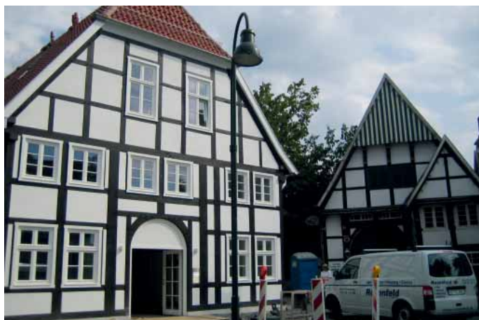
In diesem denkmalgeschützten Haus im ostwestfälischen Rheda-Wiedenbrück wurde das Badezimmer mit einer bodengleichen Dusche mit Linienentwässerung modernisiert.