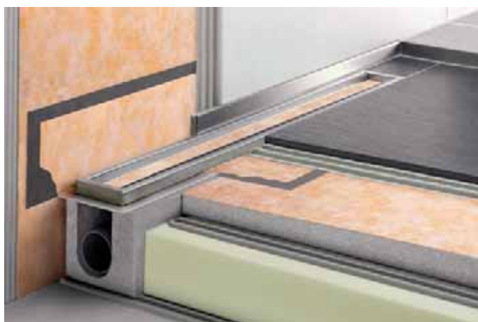
Besonders Linienentwässerungen liegen derzeit voll im Trend. Die Systeme von Schlüter-Systems erfüllen dabei hohe Anforderungen an den Schallschutz und sind sicher und einfach einzubauen.

Ein zweiter Vorteil einer solchen Fußbodenheizkonstruktion liegt im geringen Energieverbrauch aufgrund der geringen Aufbauhöhe. In Verbindung mit der guten Wärmeleit- und Speicherfähigkeit keramischer Fliesen oder Natursteinplatten ergibt sich so ein deutlicher heiztechnischer Vorteil. Der geringe Energieverbrauch zur Wärmeerzeugung ist in jedem Bauvorhaben ein nicht